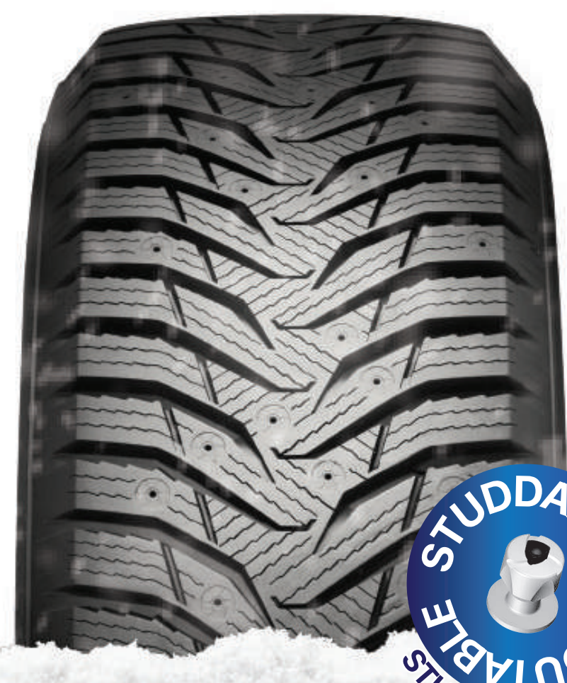
WINTERCRAFT Ice WI31+ météorologiques extrêmes