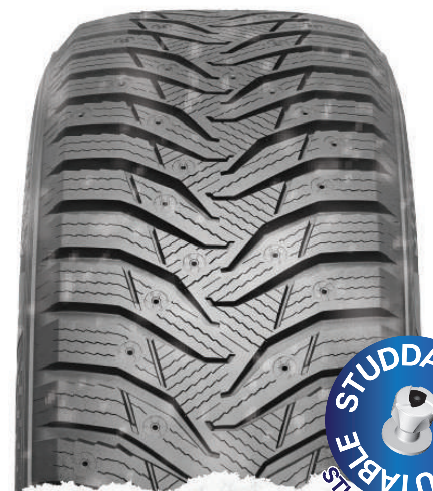
WINTERCRAFT Ice WS31 (SUV) météorologiques extrêmes