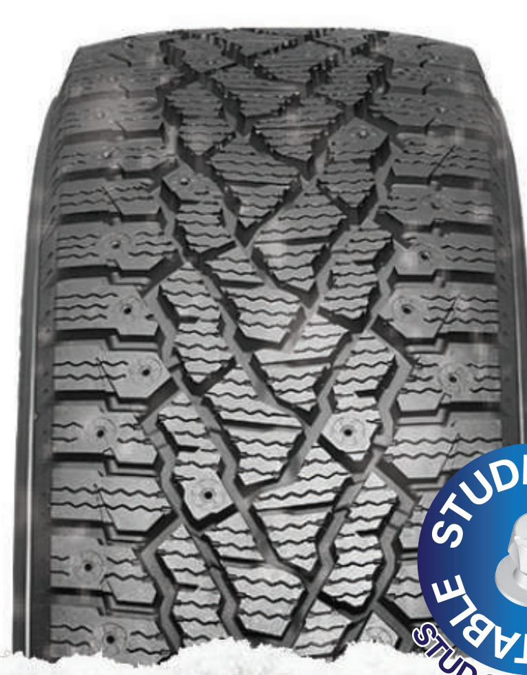
WinTer PorTran CW11 pneu spécialisé