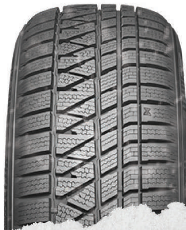
WINTERCRAFT WS71 (SUV) sport · performants