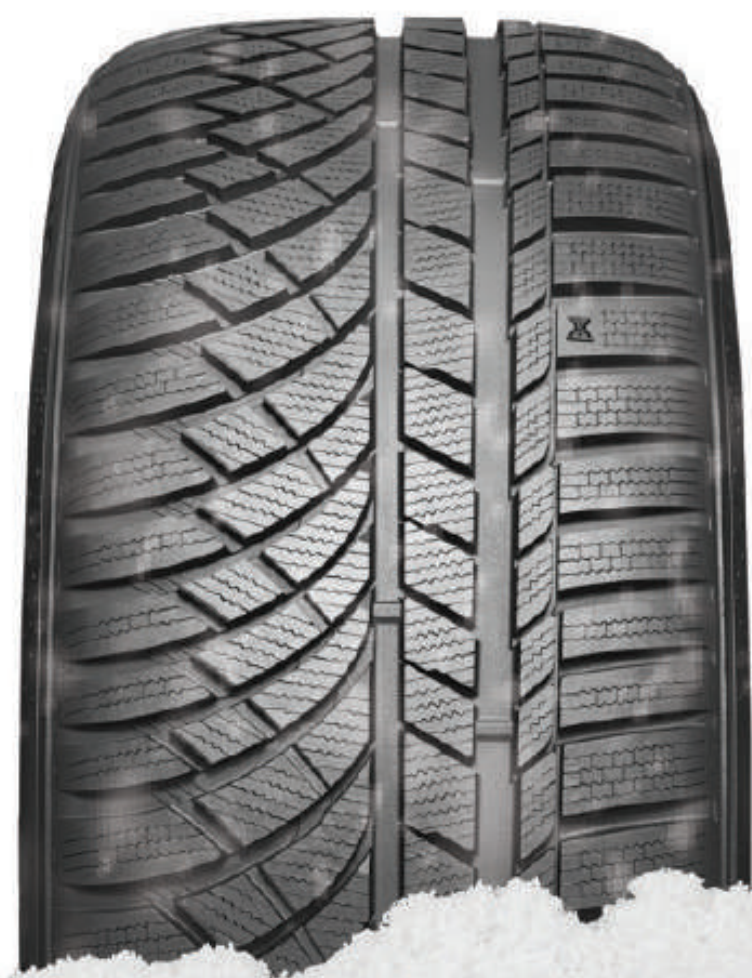
WINTERCRAFT WP72 sport · performants

Offre valable du 1er octobre au 31 décembre 2024